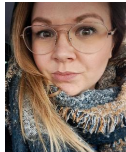
Norin (+ administratie)