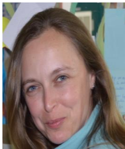
An (+ administratie)

Ons team van kinderbegeleid(st)ers staat in voor de dagelijkse werking van de opvang. Hun belangrijkste taak is het zorgen voor het welzijn en het welbevinden van de kinderen. Daarnaast verzorgen zij dagelijkse contacten met ouders, administratieve taken (zoals aanwezigheden registeren) en het dagelijks onderhoud van de opvanglocatie.